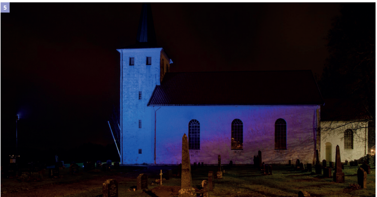
1. Slottsfjellet Foto: Ole Johan Frogner | 2. Kopervik kirke Foto: Jorunn U. Nordstokke | 3. Kristiansten festning Foto: Heidi Olavsbråten | 4. Åndasnes barneskole Foto: Jonny Rønning | 5. Skjee kirke Foto: Ole Johan Frogner