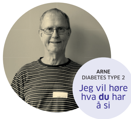
ARNE DIABETES TYPE 2 Jeg vil høre hva du har å si