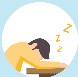
Trøtthet/mangel på energi