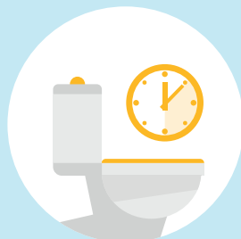
Mye tissing (også om natten)